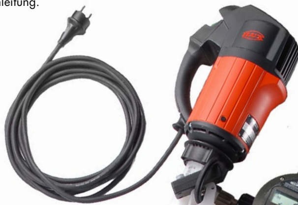
FLUX Flüssigkeits-Mengenmesser mit integriertem Schaltverstärker und Funk-Empfänger

Das Bild zeigt ein funkferngesteuertes FLUX Abfüllsystem mit FLUX Abfülleinheit (FAE) in PVDF und Funkfernsteuerung (FRC), Flüssigkeits-Mengenmesser FMC 100 ETFE mit Schaltverstärker FSV 100 mit integriertem Funk-Empfänger sowie eine Fasspumpe F 424 PVDF mit Motor F 458 und Chemie-Schlauchleitung.