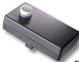
FLUX FRC 100